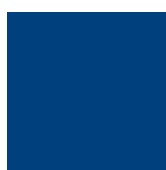
MO (tmavě modrá) RAL 5010

Uvedené barvy jsou ovlivněné nastavením Vašeho monitoru a mohou se mírně lišit od skutečných. Pro kontrolu reálné barevnosti použijte vzorník plechů nebo vzorník barev RAL.